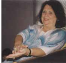
Gerda Boyesen † 2005